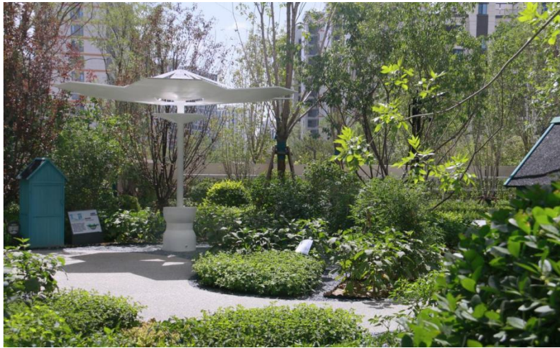
△雨水收集器，收集的雨水还可以用来浇花、浇菜